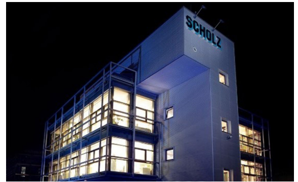
Die Scholz Recycling GmbH ist Teil der CHIO Environmental Group