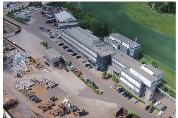
Das Unternehmen Scholz Recycling ist spezialisiert auf die Aufbereitung und Verarbeitung von Altmetallen

Kontaktieren Sie uns: Wir beraten Sie gerne.